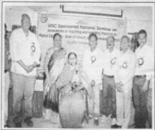
ఆర్.జె.డీ. డార్లన్ ను సన్మానిస్తున్న అధ్యాపకులు