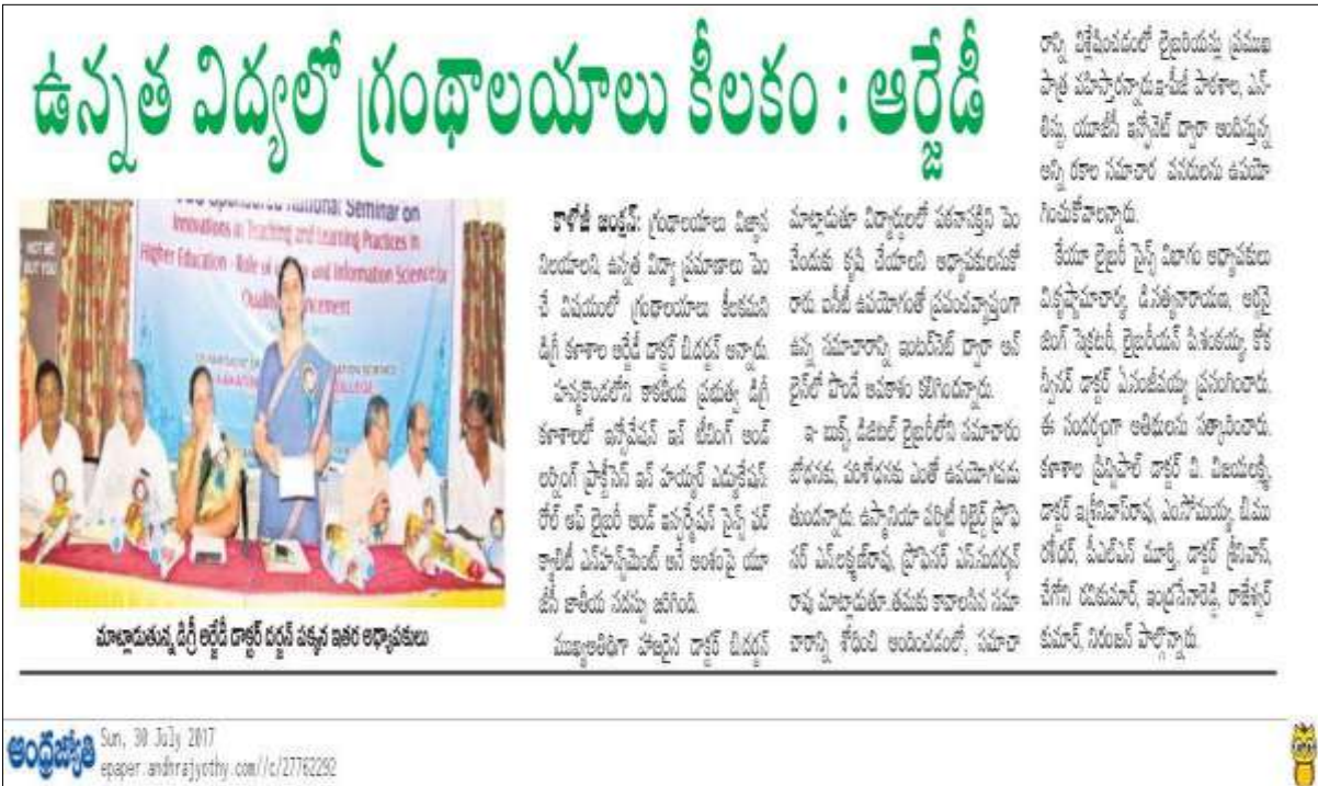
News published in Andhrajyothi e paper on 30-07-2017